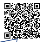
認知症支援・介護予防センターHP

「自分の健康は自分で守る」ために感染予防と健康維持の両立を図りましょう。 ※フレイルとは、加齢により心身が弱って介護が必要になる危険性が高い状態のこと。早く気付いて取り組むことで予防・回復が可能です。